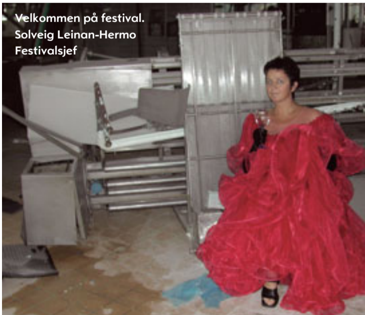
Det gjelder å være tidlig ute.. men ops - jeg forvillet meg litt for tidlig inn på Arktisk kultursenter.